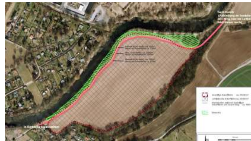
geplanter Verlauf des Radweges

das jetzige Maisfeld, wo bereits früher ein Weg war, angelegt wird. Dieser ehemalige Wirtschaftsweg, der zur Zeit überackert ist, besteht noch katastermäßig und befindet sich im Eigentum der Stadt Jena. Es handelt sich um den früheren Kunitzer Wiesenweg.