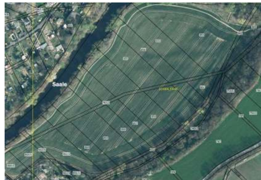
Flurstücke im betroffenen Abschnitt

das jetzige Maisfeld, wo bereits früher ein Weg war, angelegt wird. Dieser ehemalige Wirtschaftsweg, der zur Zeit überackert ist, besteht noch katastermäßig und befindet sich im Eigentum der Stadt Jena. Es handelt sich um den früheren Kunitzer Wiesenweg.