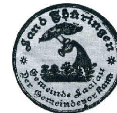
Siegel der Gemeinde Laasan um 1930